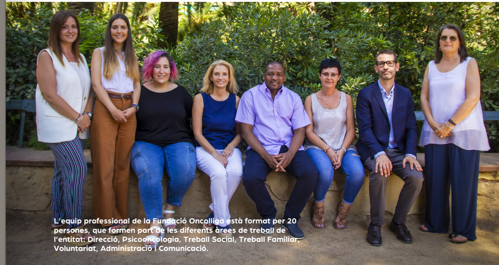
L'equip professional de la Fundació Oncolliga està format per 20 persones, que formen part de les diferents àrees de treball de l'entitat: Direcció, Psicooncologia, Treball Social, Treball Familiar, Voluntariat, Administració i Comunicació.

El Patronat de la Fundació Oncolliga és el màxim òrgan responsable de l'entitat format per persones voluntàries que vetllen per la consecució dels fins fundacionals, ja sigui assistint al President en la presa de decisions o bé ajudant la direcció a implementar les decisions preses dins l'organització.